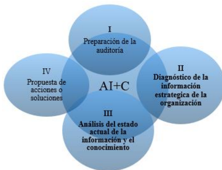
Fig. 1 - Auditoría de la información y el conocimiento para un centro de investigación.

La propuesta que se presenta para auditar información y conocimiento en procesos de investigación (AI+C), Se estructuró en cuatro etapas, como se muestra en la figura 1, que incluye, entre otros aspectos, el análisis de las necesidades, la realización de un inventario, el análisis de los flujos y la elaboración de un mapa de información y conocimiento.